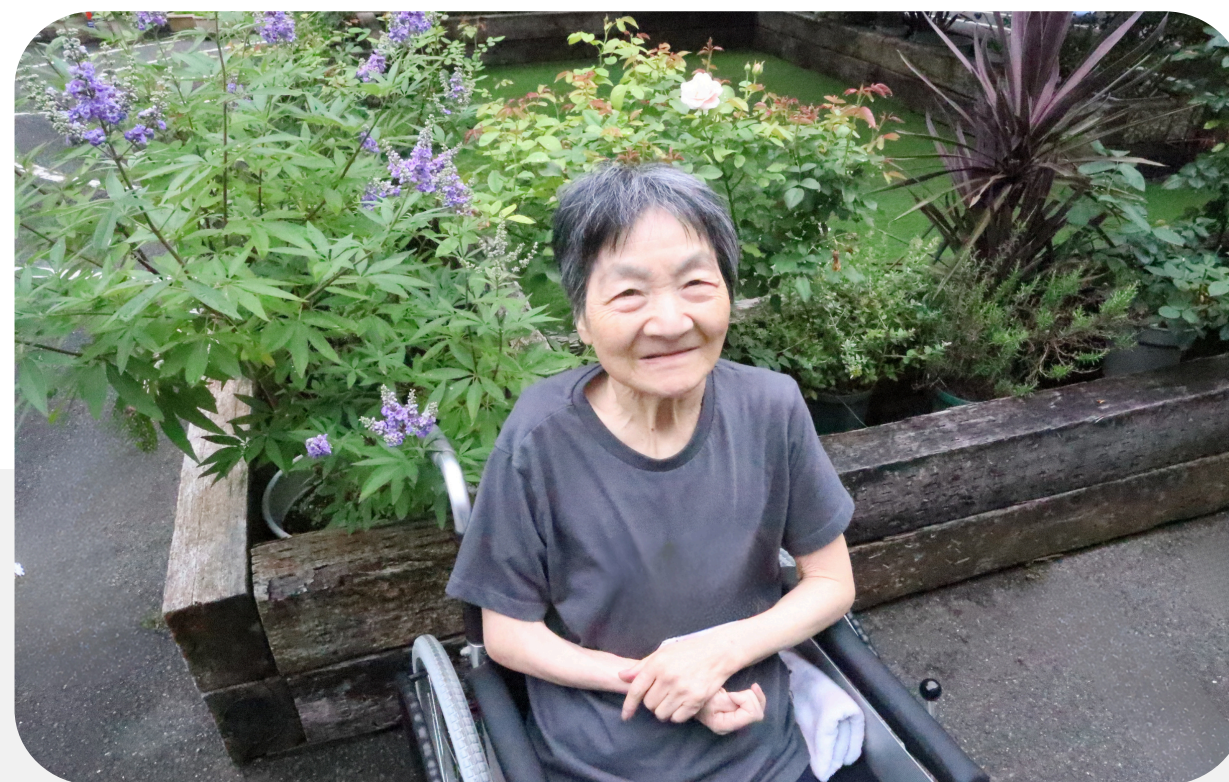
ローズ東村中庭にてバラを楽しむご利用者様