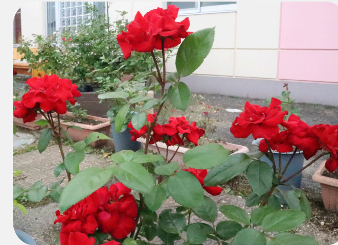
ローズ東村を彩る花々たち